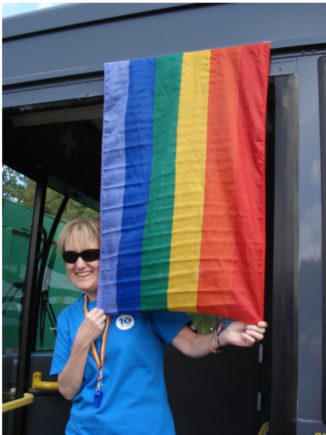
Roedd y tîm yn awara'n stann i'w groeswriaid, hoyw, deurywiol neu drawsrywiol ar fws allgymorth y Cynulliad ym Mardi Gras Caerdydd-Cymru 2009

Am y tro cyntaf, roedd gan y Cynulliad Cenedlaethol bresenoldeb ym Mardi Gras Caerdydd-Cymru. Roedd aelodau o Dîm Digwyddiadau a thîm Cydraddoldeb a Mynediad y Cynulliad, ac aelodau o'n Rhwydwaith Staff LGBT yno i groesawu ymwelwyr i'n Bws Allgymorth, i'w hysbysu ynglŷn â rôl a gwaith y Cynulliad ac i egluro pa gymorth sydd ar gael i gyflogeion lesbiaidd, hoyw, deurywiol neu drawsrywiol yn y Cynulliad.