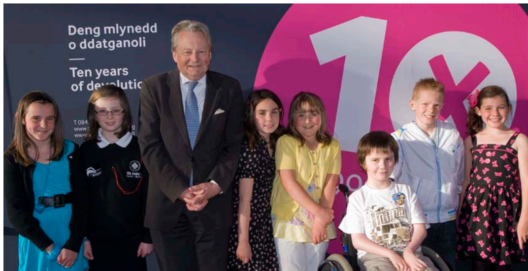
Y Llywydd yn cyfarfod pobl ifanc ar 12 Mai 2009

I ddathlu deng mlynedd ers cynnal Cyfarfod Llawn cyntaf Cynulliad Cenedlaethol Cymru, cynigwyd y cyfle i blant o bob rhan o Gymru a anwyd ar 12 Mai 1999 ddathlu eu pen-blwyddi mewn steil yn y Senedd. Ymunodd plant o Gaerfyrddin, Neyland, Wrecsam, Abertawe, Caerdydd, Casnewydd a Thywyn ag Aelodau'r Cynulliad a chyn Aelodau'r Cynulliad i nodi'r diwrnod arbennig hwn.